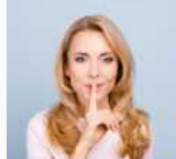
Scopri Conto Mediolanum